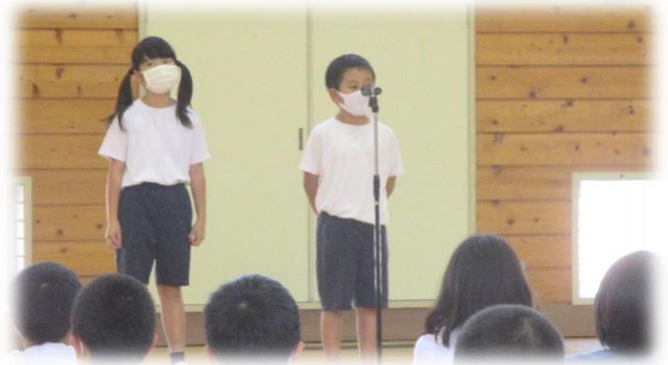
各学級の宝物発表(1年)