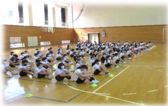
全校児童が体育館に整列