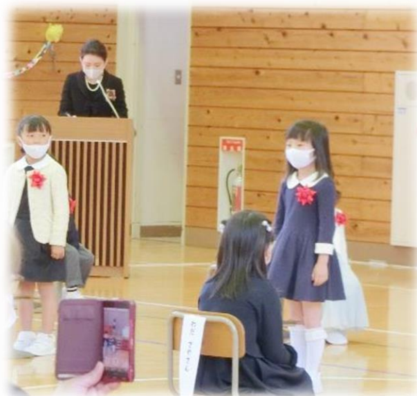
名前を呼ばれて元気に返事をする1年生

1年生のみならず、どの学年の子どもたちも、この3週間という短い間に、すっかり進級した学年らしい姿になっています。改めて子どもたちの成長する力に驚きを感じます。