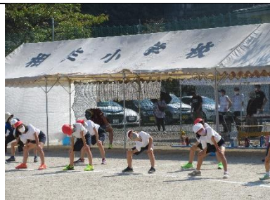
＜ストレッチ体操 3・4年＞