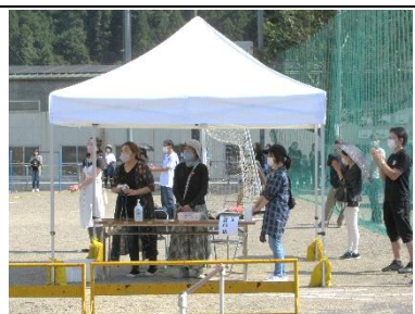
＜受付での健康チェック＞