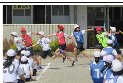
＜5・6年 障害物リレー（団体種目）＞