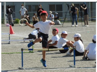
＜1・2年 ハードルリレー（団体種目）＞