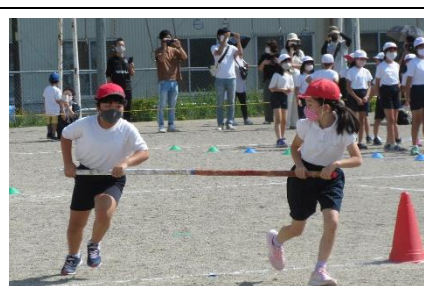
＜3・4年 台風目（団体種目）＞