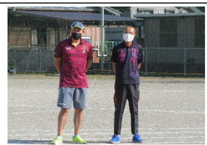
＜50m走の指導者 今園さん・渡邊さん＞