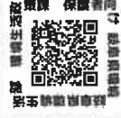
子ども向け 動画視聴用QRコード