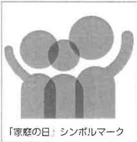
「家庭の日」シンボルマーク