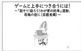
ゲームと上手につき合うには！ ～「話そう！語ろう！わが家の約束」運動、取組の前に（保護者編）～