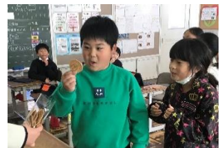
3年生：はじめて食べるおかしを手にして

5つのお店に出かけ、取材をしてきました。八幡に住んでいても、お店の商品を食べたことがない子どももおり、いただいたお菓子を初めて食べた子は「こんな美味しいものが八幡にあったんだ!」「こんど、お小遣いで買いに行こう」「私の家の近くだから、いい匂いがするよ」など、いろいろな感想を持ちながらお菓子をいただきました。見たり聞いたりするだけでなく、香りや味も勉強することができました。食べた感想も発表原稿の中にしっかりと入れてシナリオをつくり、そしてICTの道具の一つ「タブレット」を活用してまとめていきます。グループごとに表現方法を工夫しながら発表の準備をしていきました。