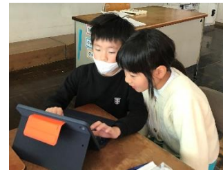
3年生：グループでのプレゼンづくり

発表日の当日は、4年生は「郡上の『水』について伝えよう」5年生は「郡上踊りのことなら任せて」、6年生は「郡上の魅力発信」とテーマに、保護者の方やこれまでお世話になった地域の方に向けて発表しました。