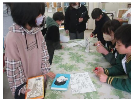
手洗いキャンペーン～健康委員会～

「楽しく本に親しめるため」「健康な毎日をすごすため」と、委員会の子たちの工夫を凝らした活動が、子供たちの笑顔を生み出し、楽しい学校生活を生み出しています。願いをもって活動する5・6年生、自分の役割に責任をもって行う姿、下級生に優しく声をかける姿が輝いていました。