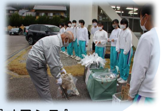
八中人権宣言 『オアシス』