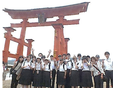
【3年生 厳島神社の大鳥居前にて】

私自身、いつも自分に言い聞かせながら経験したことを次に生かすことを大切にしています。