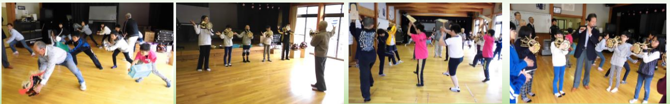
【神楽のお師匠さん方】

5年生は、この時初めて神楽の練習に臨みました。獅子、鼓、田打ちのやり方をお師匠さんたちから聞いた後、どれも体験してみました。そして、自分の担当が決定しました。どの子もやる気満々。これからも運動会に向けて練習していきます。