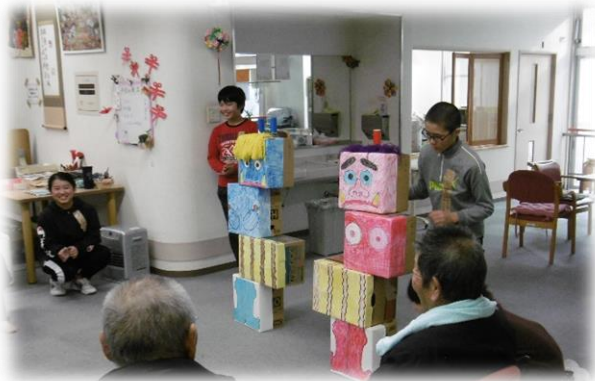
6年生 デイサービス訪問

今年度もいろいろな体験をする中で、目には見えませんが子どもの一つ一つの体験は、たくさんの言葉を獲得し思考力や表現力を高めたと感じます。また、地域のくらしや自然・文化、産業や福祉を知り、地域を大切にしている気持ちも育っていると感じています。