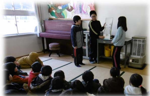
新1年生 入学説明会