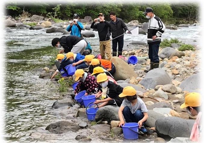
4年生：鮎の放流の様子（「長良川探検隊」の学習より）