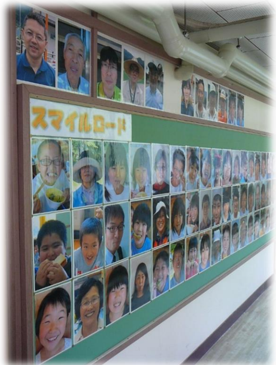
＜職員室前スマイルロード＞

明日より40日間の夏休みが始まります。子どもたちは地域で生活する機会が多くなります。 地域の行事等に積極的に参加 させていただき、 地域でも子どもたちを見守り、将来生きて働く力を地域で育ん でいただきますようよろしくお願いいたします。