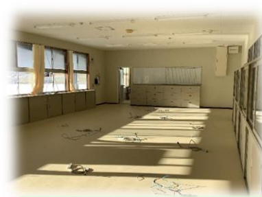
【Before】 仮設校舎の職員室