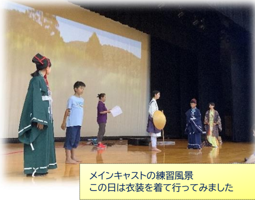
メインキャストの練習風景 この日は衣装を着て行ってみました