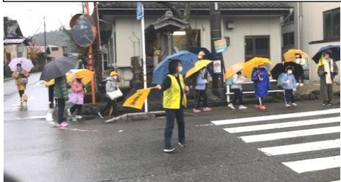
『登下校見守りボランティア』による活動の様子

保護者や地域の皆様のおかげで、児童の安全・安心な生活が見守られ、今年度もクラブ活動や総合的な学習の時間等を通して、心豊かで創造的な学習ができました。こうした地域ぐるみの教育活動の成果として、仲間との温かい関わりが増えています。