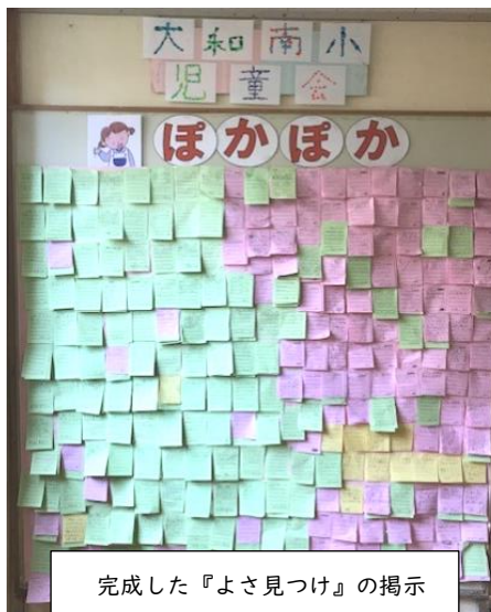
完成した『よさ見つけ』の掲示