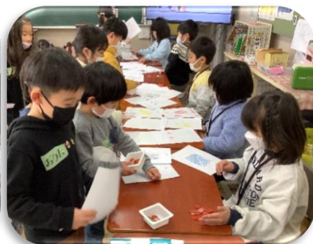
新入児と1年生との交流会