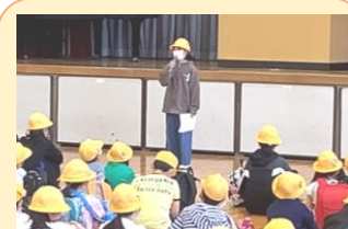
相手を見て話す6年生