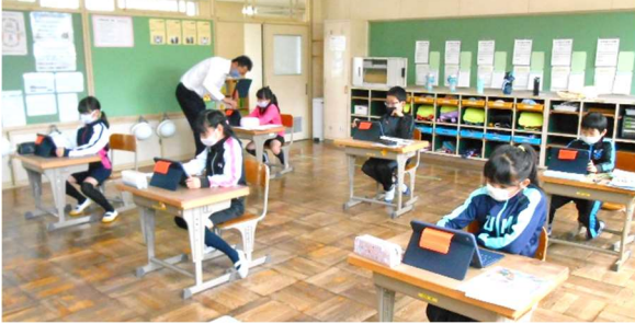
学校の畑で撮影した生き物の写真データを使っての観察記録作成。少しずつ端末使用に慣れていきます。

児童1人1人にタブレット端末が貸与され、保護者皆様のご理解を得て、授業でも少しずつ活用しています。子どもは、タブレット端末を使う上での注意事項を確認し、少しずつ使い方を身に付けています。教師用端末から電子黒板に資料を映したり、仲間の意見を映したりし、主体的に情報収集・活用、まとめ、表現などできる様にしていきます。