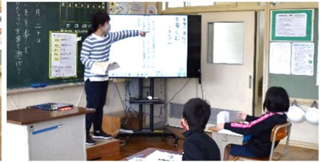
教師用端末から資料やデジタル教科書を電子黒板に映しています。 (左：6年生外国語 右：3年生国語)