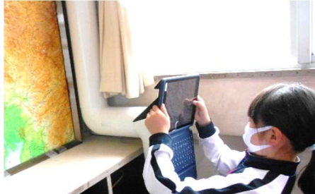
必要な風景や資料をパチリ。図画工作で描くものをデータで保存したり、自分の端末で拡大したりして見ることができます。