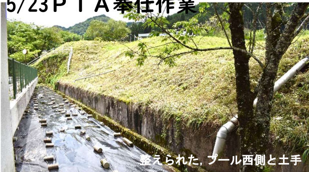
造られた、プール西側と土手

コロナ感染拡大防止のため、親子での活動は、中止となり、P T A本部役員と学校職員で、運動場周り土手の草刈りやプール西の草引き、マルチ張りを行いました。また、作業前日には、保護者参加が中止となったことで、自主的に保護者の方が土手の草刈りを行ってくださいました。